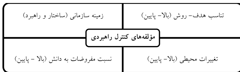
شکل ۱. مؤلفه‌های اصلی اجرای نظام کنترل راهبردی (یافته‌های محققین)

براساس مفروضات ایجاد شده در راستای بهبود اجرای کنترل راهبردی، پژوهش حاضر در تلاش است ضمن شناسایی چالش‌های اجرای کنترل راهبردی بتواند سطح‌بندی مناسبی از این چالش‌ها با توجه به این مؤلفه‌ها ارائه دهد.